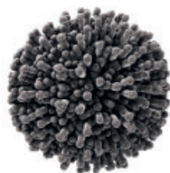
Chitosano da Aspergillus niger

LalVigne BOTRYLESS™ riduce l'impatto dei danni causati da questo fungo patogeno rinforzando le difese naturali della pianta ed esercitando un'azione diretta di inibizione sulla proliferazione del fungo. Per queste sue caratteristiche LalVigne BOTRYLESS™ può essere utilizzato sia come trattamento preventivo che come trattamento curativo in grado di far regredire l'infezione.